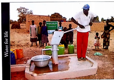
Water for life