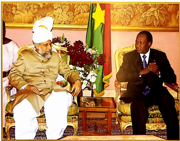
Sa Sainteté Hazrat Mirza Masroor Ahmad Khalifatoul Massih V avec son Excellence Blaise Compaoré Président du Faso lors de son passage au Burkina en 2004