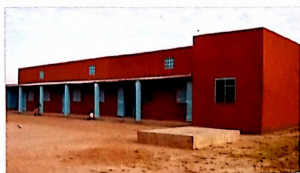
École Primaire de Léo