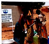
Fontaine à Kaya