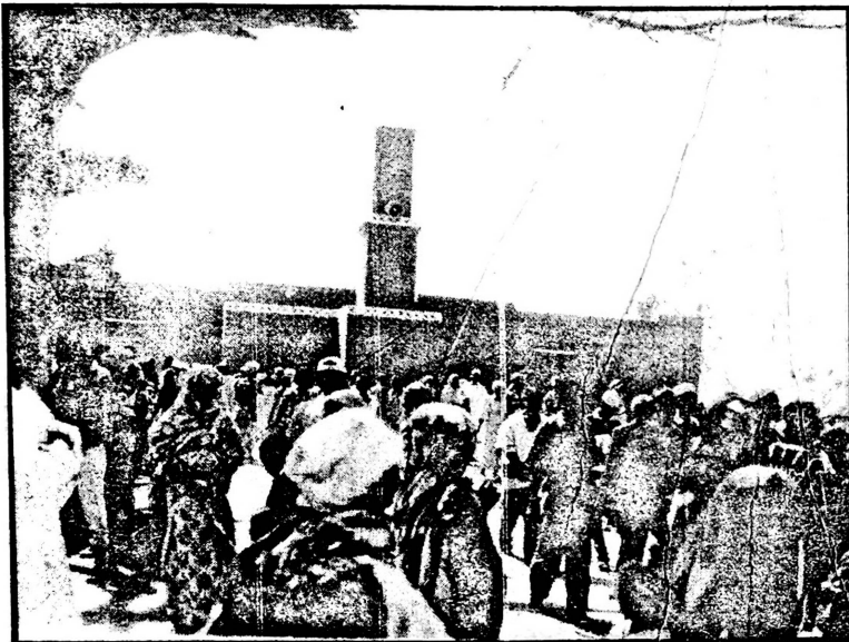
Une foule de fidèles ont pris d'assaut la place de la mosquée.