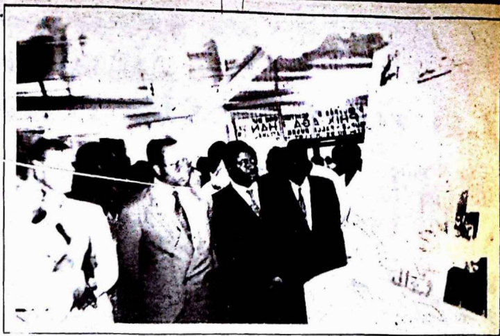
Les personnalités pendant la visite guidée de l'exposition

architecturale) et la fondation Agâ-Khan, avec l'appui financier de plusieurs partenaires. "Architecture for a changing world" réunit six cycles de prix décernés par un jury international de 1980 à 1995 et présente les 70 œuvres récompensées par "L'Aga Khan award for architecture", réparties dans 26 pays, y compris les prix d'honneur récompensant à l'œuvre de l'architecte égyptien Hassan Fathy et celle de l'architecte irakien Rifat Chadirji.