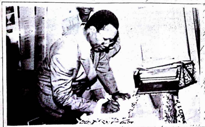
A l'issue de la visite de l'exposition, le ministre Mahamoudou Ouédraogo a couché ses sentiments dans le livre ouvert à cet effet.