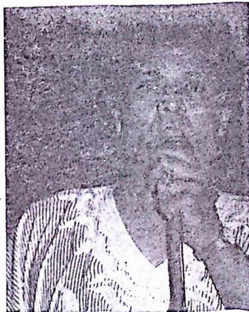
Le représentant de l'ambassade de Libye.