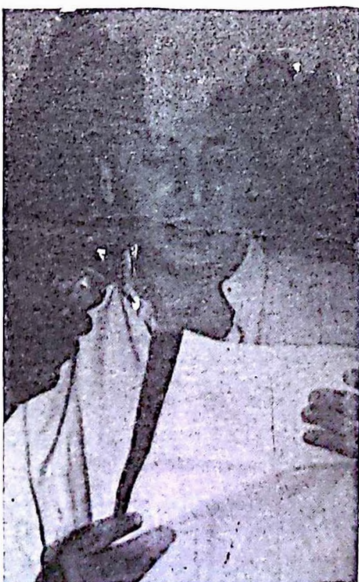
Le représentant de l'ambassade d'Algérie.