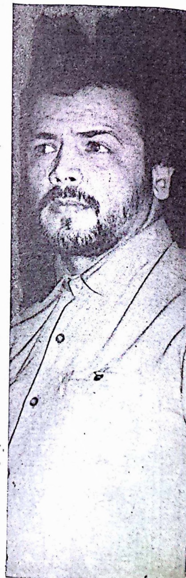
Le représentant de l'ambassade d'Iran.

dis sont autant d'appâts qui attirent ces fidèles dans ce petit village, devenu célèbre par la force des choses" (cf Sidwaya Magazine no 27-28 1990).