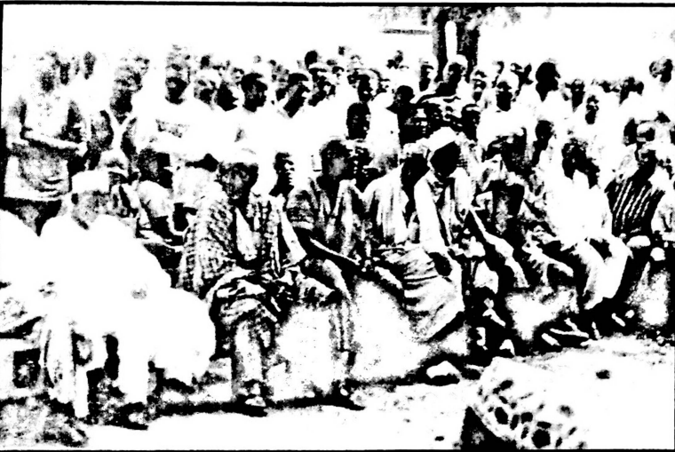
Une population plus que jamais déterminée à aller jusqu'au bout de leur lutte.

Ce sont entre autres: la rupture d'avec leur histoire que la disparition de ces anciens quartiers entraînera chez les natifs; la présence dans la zone de 36 mosquées et dont la disparition donnera aux fidèles le sentiment d'être marginalisés par rapport aux autres confessions religieuses qui d'ailleurs connaissent le même sort; une grande partie du 3e âge(retraités) tire sa subsistance des revenus locaux grâce à l'avantage géographique(intense activité commerciale). D'où leur refus de ce projet devant les autorités chargées de sa mise en oeuvre