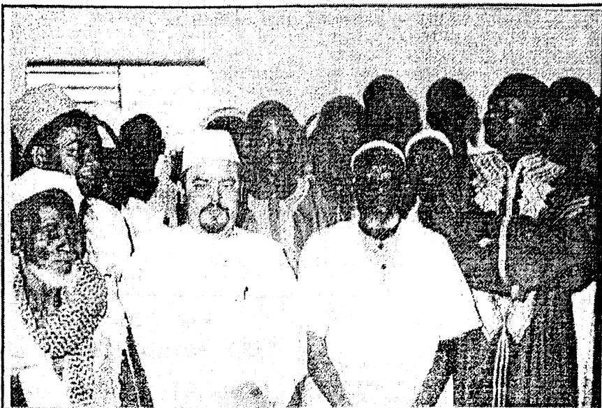
Les autorités administratives et coutumières de Sidéradougou. 2e à partir de la gauche, le

La nouvelle mosquée, fruit d'une coopération entre l'Agence des Musulmans d'Afrique, l'ADERSI (Association pour le développement de la région de Sidéradougou) et la CMS (Communauté musulmane de Sidéradougou), est une bâtisse en