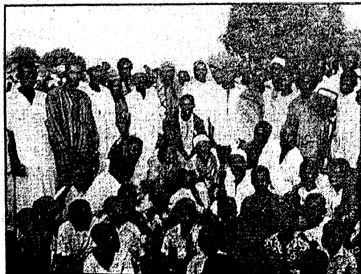
Photo de famille après l'inauguration