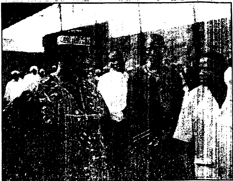
Les fidèles musulmans ont répondu nombreux à l'appel

chapitre 3 du Saint Coran bref notons que ce passage sus-cité a été le leitmotiv d'un atelier sur les voies et moyens pour l'instauration d'un comité de coordination des associations et mouvements islamiques du Burkina Faso". A travers cet atelier, l'espoir en une Fédération des associations et mouvements islamiques dans notre pays à l'instar du Conseil national islamique de la Côte d'Ivoire est née. Pour quand ? L'avenir nous le déterminera. Cependant, l'initiative ou le premier pas mené dans ce sens par les musulmans de Banfora est à féliciter. Car ils ont pu faire fi de leur appartenance à la communauté musulmane, au