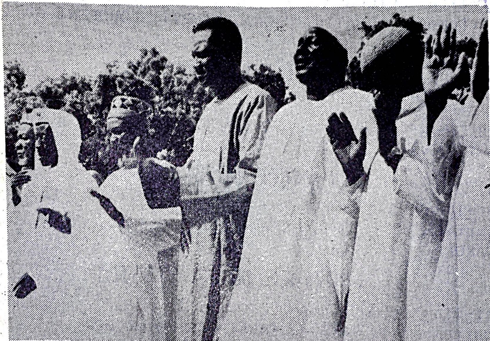
Une vue des officiels à la prière

la tradition musulmane, cela assure le pardon à tous les musulmans présents ce jour-là à ARAFAT.