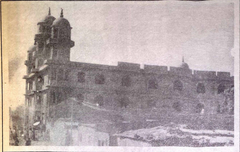
La grande mosquée sunnite de Zangouétin

H ier matin la mosquée sunnite sise au quartier Zangouétin de Ouagadougou avait l'allure d'un camp assiégé. En effet la crise qui sourdait au sein