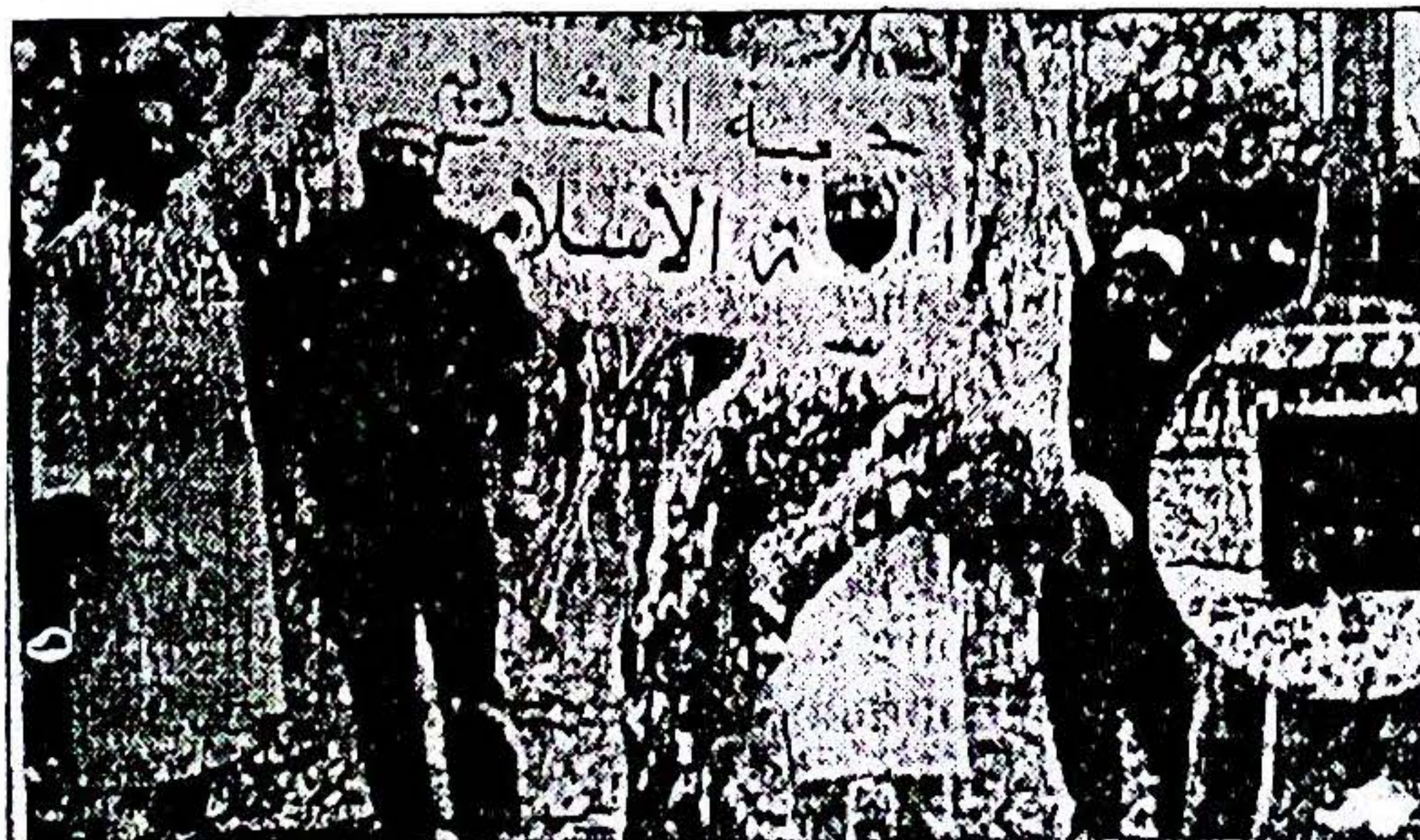
"Nous leurs montrerons nos signes jusqu'à ce qu'il leur apparait clairement que le Coran est la vérité"

D ans une forêt australienne en 1993, un groupe de musulman d'une organisation non gouvernementale Islamique (ONG) a trouvé un arbre en position de gémissement alors qu'il était à la recherche de la qiblah (direction de la prière). (Cf. photo: Un arbre en posture de gémissement dans la prière rituelle). En effet, cet état extraordinaire de