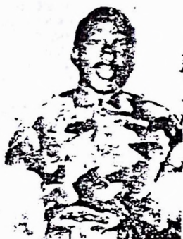
Le président du Faso en compagnie du président du comité permanent de l'assemblée nationale révolutionnaire du Bénin.

En somme, le forum était positif, précise le capitaine Thomas Sankara.