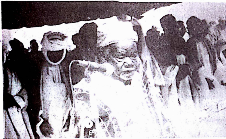
Le grand Imam Ibrahim Kouanda

A Ouagadougou, dès 9h, les fidèles vêtus de leurs plus beaux boubous, ont convergé vers les lieux de prière.