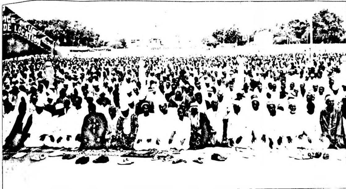
Au cours du pèlerinage, les fidèles musulmans observent plusieurs étapes de prière, de méditations et de recueillement.

Après la première édition 1996, la Commission nationale d'organisation du pèlerinage à La Mecque (CNOPM) présidée par les ministres Yéro Boly de l'Administration territoriale et Ablassé Ouédraogo des Affaires étrangères avait entamé depuis le retour du Hadj 96 le processus des préparatifs. Aujourd'hui, les choses semblent baigner comme dans l'huile ; malgré quelques difficultés mineures, l'organisation du Hadj 97 apparaît mieux cernée de par l'informatisation du processus de paiement des frais à la programmation des pèlerins par vol d'Air Afrique. C'est ainsi que depuis une semaine, les membres de la commission en l'occurrence le ministre Boly et le responsable de la commission finances et transport veillent pratiquement 24 heures sur 24. Actuellement tout roule comme sur des roulettes, car c'est aujourd'hui que deux vols d'Air Afrique (B747 et DC 10) de capacité respective de 490 passagers et de 270 passagers quittent le Burkina pour l'Arabie Saoudite. Selon le ministre Yéro