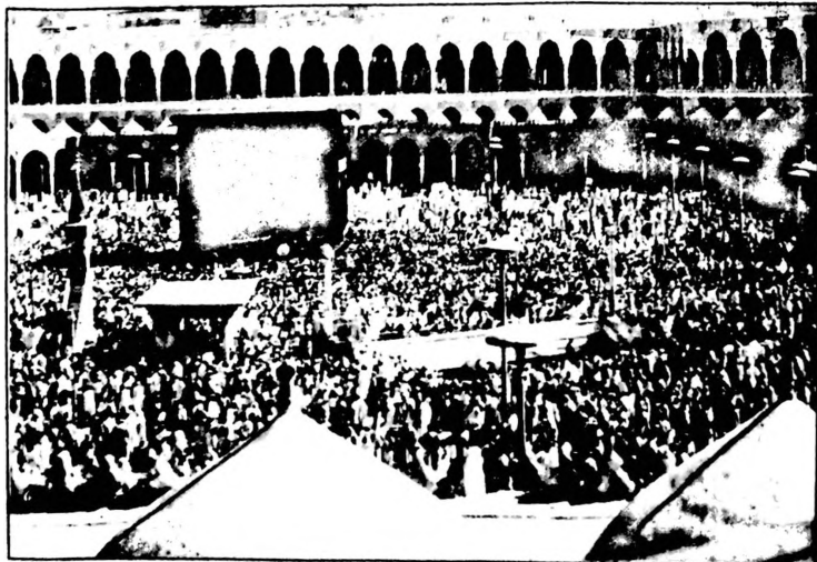
Chaque année, les pèlerins du monde entier vont effectuer les traditionnels sept tours de la Kaaba à l'intérieur se trouve la pierre noire. Le pèlerinage à La Mecque est le 5e pilier de l'Islam.

Au total, les pèlerins burkinabè passeront un mois sur la terre Sainte de l'Islam où l'essentiel de leur séjour sera consacré aux prières, invocations, recueils pour demander le pardon, la grâce et la miséricorde de Allah, le Bon Dieu.