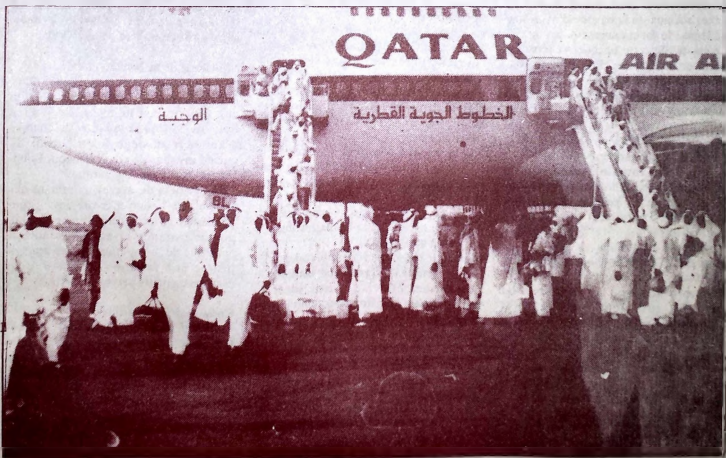
Arrivée des pèlerins à Djeddah.

C'est très tôt ce matin, aux environs de 00 heure que les premiers pèlerins burkinabè ont quitté Ouagadougou à destination de l'Arabie Saoudite. Ce premier vol par Boeing 747 de la compagnie multinationale Air Afrique avait à son bord 490 pèlerins et mettra 6 heures pour relier Ouagadougou à Djeddah. Ils sont cette année environ 1650 pèlerins burkinabè contre 1603 en 1996.