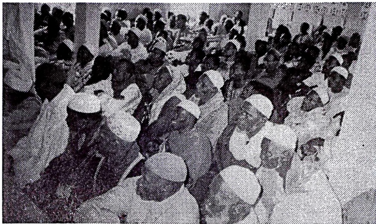
Après la cérémonie d'inauguration, les fidèles ont célébré la prière dans la nouvelle mosquée.

Il y a longtemps que le petit village de Kékaba n'avait pas vécu un événement aussi grandiose que celui du vendredi 28 avril 2000. Il est vrai que la mobilisation des habitants et particulièrement les musulmans en cette occasion était pleinement justifiée car depuis 1965 date d'inauguration de l'ancienne mosquée, on n'avait plus fêté pareil événement. Les délégations sont donc venues de tous les villages environnants, des départements de Safané, Bondokuy ainsi que des villes de Dédougou, Nouna, Boromo, Bobo-Dioulasso et Ouagadougou. Tout ce monde qui a partagé la joie avec les fidèles musulmans voire tous les habitants de Kékaba, joie d'autant plus légitime que la communauté musulmane de ce village attendait cette mosquée depuis bien longtemps. L'ancienne construite en banco était