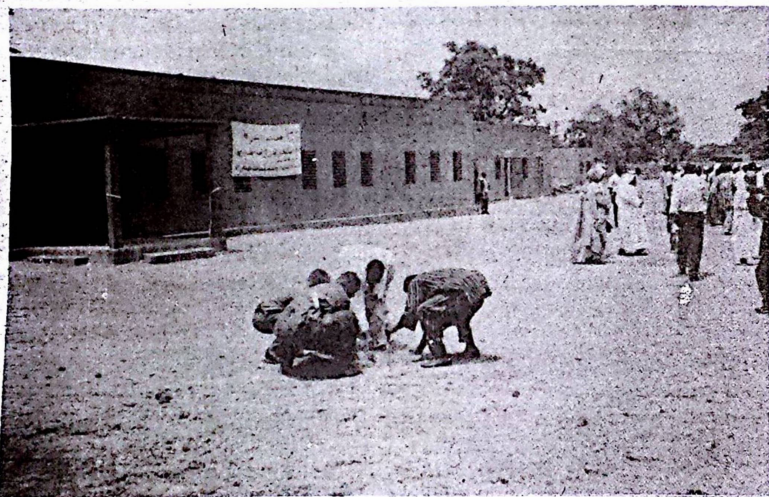
On voit ici (au fond) les bâtiments de l'orphelinat de Fada

A l'issue de l'inauguration de l'orphelinat, l'on a procédé à la pose de la 1 re pierre du lycée «Sabil-El Nadiyah», au secteur 3 de Fada sur la route de Comin-Yanga, financé par le «Qatar charitable association» ■