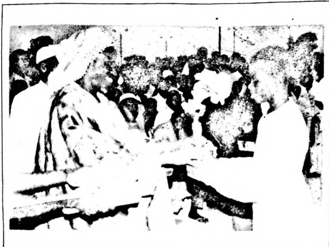
Le capitaine de l'équipe victorieuse recevant la coupe des mains d'un leader religieux.