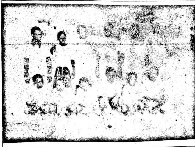
L'école Nouridine grâce à son réalisme au tir au but est venue à bout de son adversaire.