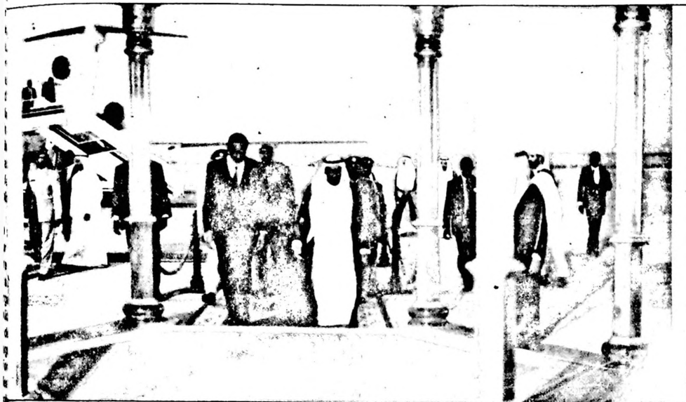
Quelques instants à la descente d'avion à Abu Dhabi : Blaise Compaoré en Compagnie de son Altesse Zaiyed, président de l'E.A.U

dirigeants de Abu Dhabi à drainer chez eux des financements étrangers sans se contenter de s'asseoir sur l'acquis du pétrole. En effet, tous ou presque tous les grands industriels de la planète se sont retrouvés à Dubaï, si on regarde l'importance des