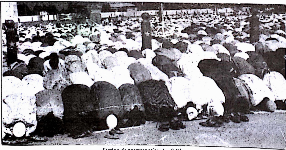
Station de prosternation des fidèles.