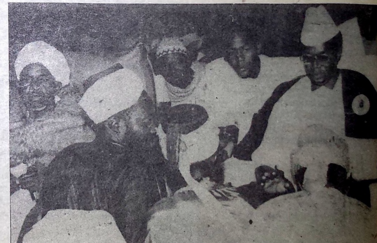
Une délégation du Nigeria se présente au Cheick qu'on reconnaît ici à gauche