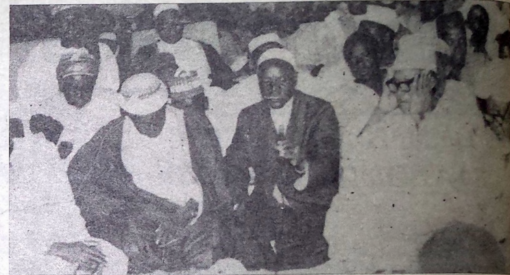
La lecture des versets du Coran. Un moment de plénitude