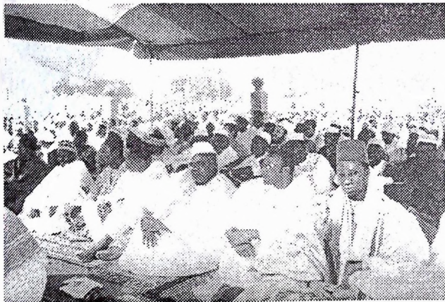
Plusieurs autorités de notre pays dont des membres du gouvernement, des présidents d'institutions, des responsables coutumiers (au 1er plan) ont assisté à la grande prière à la place de la Nation.

être distribuée aux pauvres, aux voisins, aux proches et une partie réservée à la consommation familiale. La fête de la Tabaski étant un