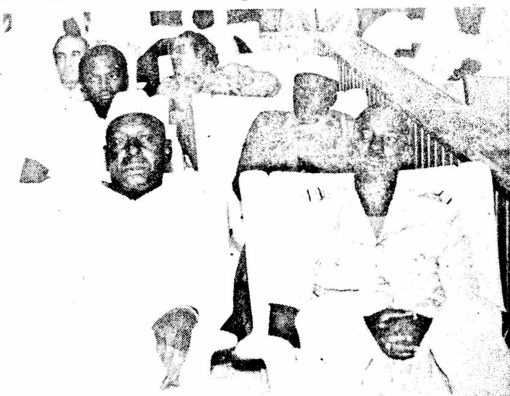
Des invités et membres de la Communauté musulmane.